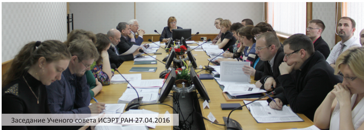
Заседание Ученого совета ИСЭРТ РАН 27.04.2016