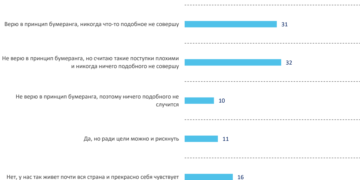
Рис. 3. Отношение российской молодежи к принципу «бумеранга» при участии в недобросовестных практиках экономической деятельности*, % от числа опрошенных

* Формулировка вопроса: «Как Вы считаете, может ли недобросовестное поведение в отношении других участников экономических отношений (обман, применение нечестных методов конкурентной борьбы, вовлечение людей в рискованные финансовые операции и т. п.) принести в будущем неудачу тому, кто это делает (по принципу «бумеранга»)».