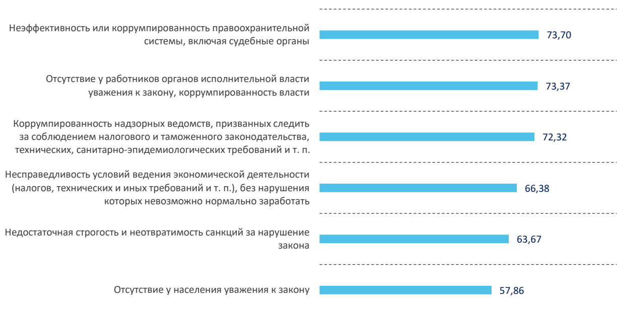
Рис. 2. Представления взрослой молодежи о факторах, способствующих криминализации российской экономики*, в индексных пунктах от 0 до 100**